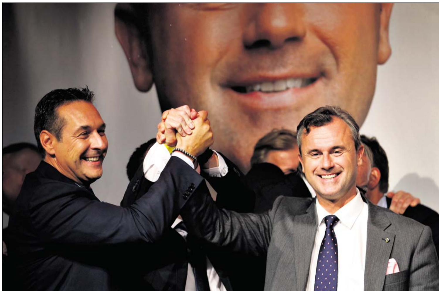
Norbert Hofer (t.h.) fra det østrigske Frihedsparti står til at vinde en snæver sejr ved landets præsidentvalg søndag. Han ses her sammen med partiets formand, Heinz-Christian Strache.