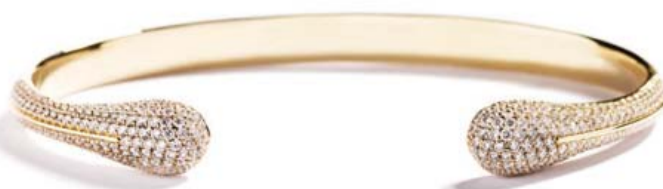
Armring med 1,80 ct. brillanter kr. 59.900,-